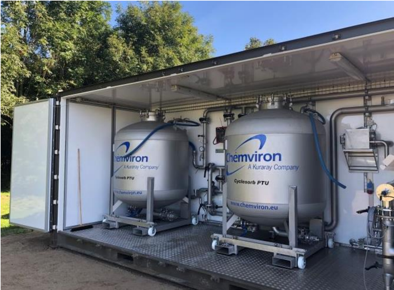
Fig. 2. Den container VCS har opstillet i skoven med kulfilteranlægget til vandrensning af boring V7.